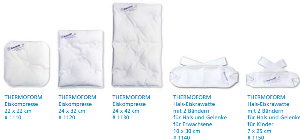
THERMOFORM Eiskomresse 22 x 22 cm # 1110