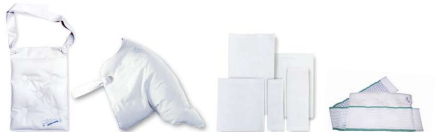
THERMOFORM Eiskomresse mit 2 Bändern für Arm- und Beinbehandlung 24 x 32 cm # 1160