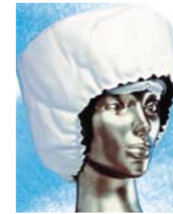
THERMOFORM IceCap Set mit Klettband und Isolierhaube # 1180

Die THERMOFORM IceCaps haben eine anatomische Passform für alle Kopfgrößen.