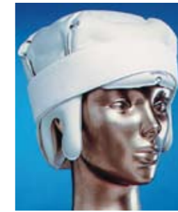
THERMOFORM IceCap mit Klettband # 1181