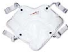
THERMOFORM Paraffinkompressen mit 4 Bandern fur den Schulterbereich # 1050