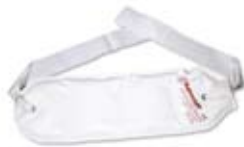
THERMOFORM Paraffinkompressen mit 2 Bandern fur Hals und Gelenke 10 x 30 cm # 1040