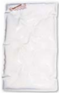
THERMOFORM Paraffinkompresse 24 x 42 cm # 1030