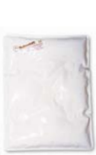
THERMOFORM Paraffinkompresse 24 x 32 cm # 1020